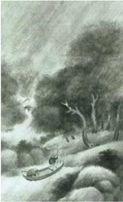
図11 《夕》石川寒巖 1922 (大正11) 年 栃木県立美術館 紙本墨画 112.2×70.8cm