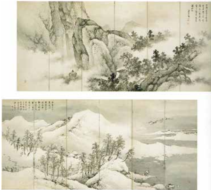
図4 《夏冬山水図屏風》小室翠雲 1923（大正12）年 群馬県立館林美術館 絹本墨画淡彩 六曲一双屏風