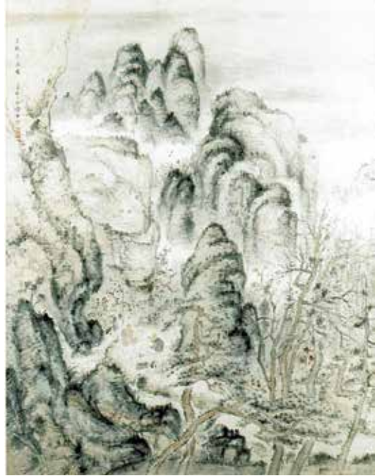
図6 《三秋逸興図》大山魯牛 1929（昭和4）年 足利市立美術館 紙本着色 151.0×118.0cm