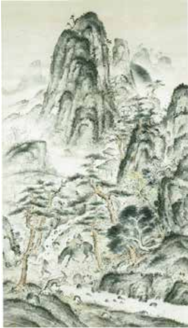
図7 《踏断流水》石川寒巖 1929（昭和4）年 栃木県立美術館 紙本着色 214.7×122.9cm