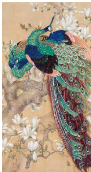
図5 《孔雀図》制作年不詳 茂林寺 絹本着色・軸 132.9×71.3cm