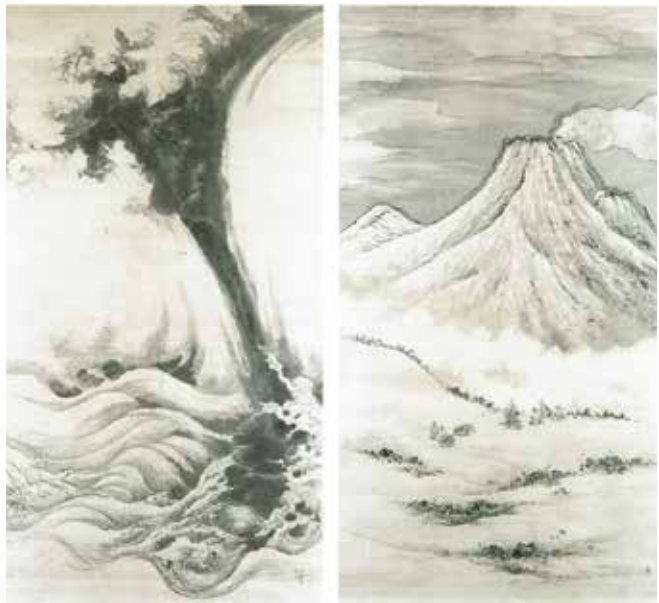
図12 《浅間山麓軍議図・龍昇天図》田崎草雲 1869 (明治2) 年頃 草雲美術館 (右) 紙本淡彩/169.6×93.6cm (左) 紙本墨画/169.4×92.0cm