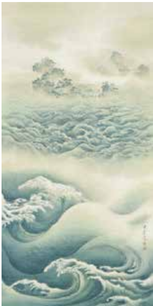
図13 《蓬莱仙宮図》 田崎草雲 1874 (明治7) 年頃 草雲美術館 絹本着色 175.0×85.0cm