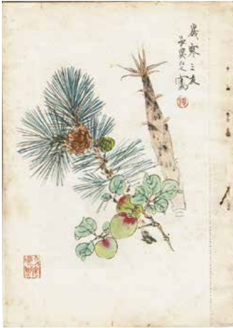
図3 《歳寒三友》小室翠雲 (『南画鑑賞』第6巻第1号)