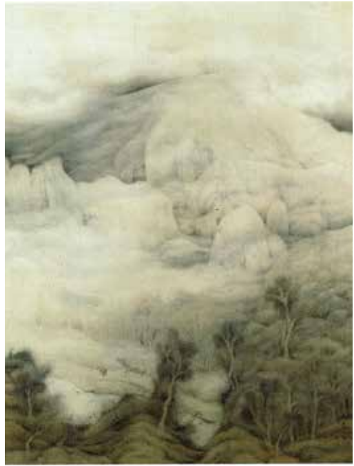
図10 《暮靄》大山魯牛 1928 (昭和3) 年 栃木県立美術館 絹本着色 110.0×85.0cm