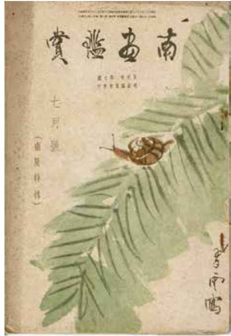
図1 『南画鑑賞』(第5巻第7号)表紙